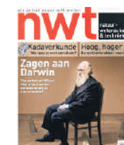
Natuurwetenschap en techniek, Darwin-special. Jaargang 76; nr 12; november 2008; € 7,45

Het tijdschrift Natuurwetenschap & techniek is het Darwinjaar 2009 met een livijge special vroeg begonnen. Hoe blij Darwin er mee zou zijn geweest valt te bezien, want de rode draad is dat de evolutietheorie, en dan met name het principe van natuurlijke selectie, na 150 jaar toe is aan groot onderhoud. Volgens de neodarwinistische 'Moderne Synthese' komt vrijwel alles in de biologie voort uit natuurlijke selectie op basis van genetische variatie. Dat blijkt toch ingewikkelder te zijn, laat NWT zien. De wetten van de embryonale ontwikkeling, omgevingsinvloeden en seksuele selectie lijken een veel grotere rol te spelen dan gedacht. Ook zijn er aanwijzingen dat juist de relatieve afwezigheid van selectiedruk het ontstaan van nieuwe kenmerken kan bevorderen. Biotechnoloog Kevin Verstrepen beschrijft hoe organismen niet alleen afhankelijk zijn van het blinde toeval van de evolutie, maar die evolutie ook tot op zekere hoogte kunnen sturen: ze kunnen beïnvloeden waar en wanneer ze mutaties in hun dna genereren. Sterker: ze kunnen veranderingen in hun genetische activiteit doorgeven aan volgende generaties. Zo laten waterlooien in reactie op de dreiging van libellen een steeklig helmpje groeien. Hun nakomelingen worden dan met dat helmpje geboren. Het lijkt de terugkeer van Lamarck's verguisde idee dat verworven eigenschappen kunnen overerven.