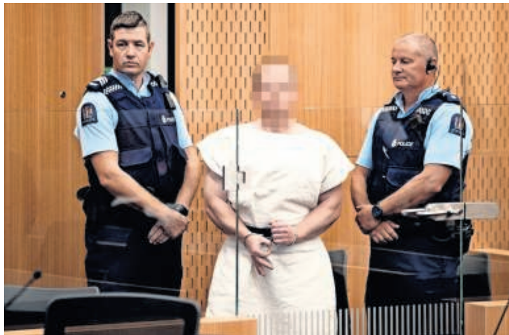
Brenton Tarrant maakt een gebaar dat wordt gelinkt aan witte suprematie.

Beide mannen noemen zichzelf redders van het witte Europa – ook de Australiër Tarrant vindt zichzelf vanwege zijn Europese wortels een Europeaan – dat zonder gewelddadig in-